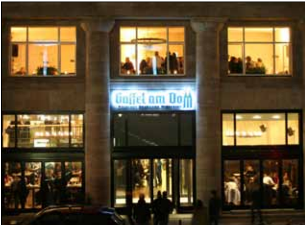
Traditions-Restaurant „Gaffel am Dom“

Aus kapazitiven Gründen ist die Teilnehmerzahl auf 120 Personen begrenzt.