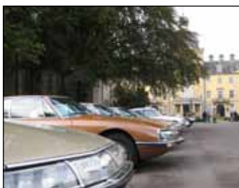
Aufstellung vor dem Schloss Bückeburg während der Herbst-Ausfahrt Hameln/Bückeburg.