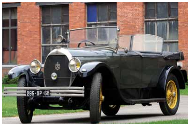
Der Hotchkiss AM2 wurde 1927 gebaut. Er gehörte einem Bankier aus Mühlhausen.