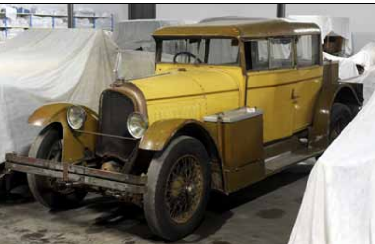
Der Voisin C7 C ist aus dem Jahr 1928.