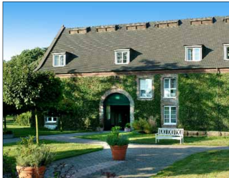
Hotel Clostermanns Hof in Niederkassel

13.00 Uhr: Mittagessen auf Schloss Bensberg 16.00 Uhr: Rückfahrt zum Hotel 19.30 Uhr: Galadiner im Hotel Montag, 28. Mai 2012 ab 10.00 Uhr: Brunch, danach Verabschiedung der Gäste