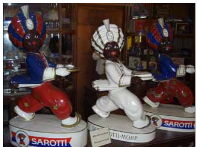
Herzlich willkommen im Schokoladen-Museum