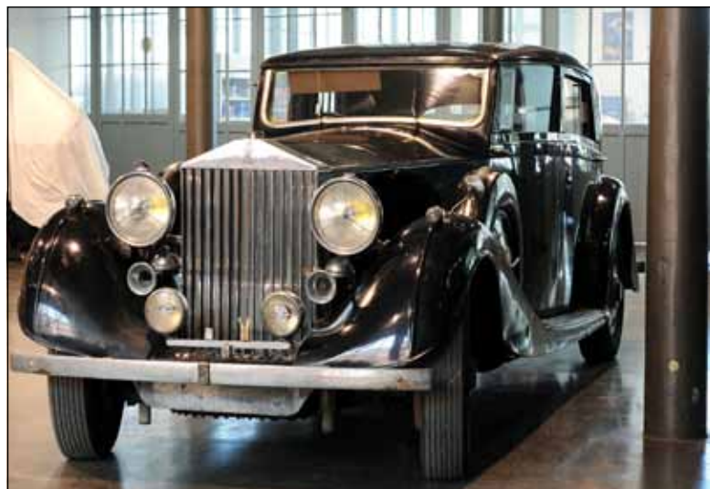
Von dem Rolls Royce Phantom II wurden insgesamt 717 Exemplare gebaut.

Die Messehallen sind geöffnet von 9 bis 18 Uhr. Die Tageskarte kostet 14 Euro. Mehr Infos auch unter www.classicmotorshow.de